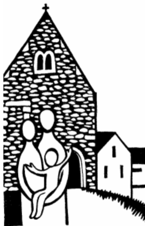
Logo Římskokatolické farnosti Uhlířské Janovice

Děkuji všem a budu na vás vděčně vzpomínat, zvláště při pravidelné mši svaté sloužené za dobrodince. Byl jsem v berounské farnosti rád. Pokud se objevíte někdy v Uhlířských Janovicích a okolí, rád se s vámi setkám.